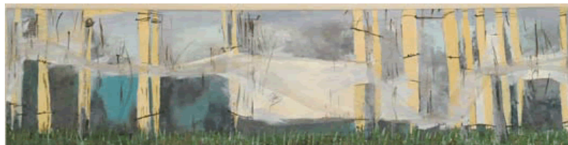
“Del color del cielo”

El análisis presentado permite afirmar nuestra hipótesis: sus RS no les permiten tomar una postura crítica para analizar si la escuela se orienta a sus expectativas o no. Los expectativas e intereses relevados de los estudiantes adultos parecieran estar fuertemente influenciadas por representaciones sociales vinculadas a la inutilidad del conocimiento escolar y a la sobrevaloración del título, que muestran poca reflexión sobre ellas al no manifestar si la ESA realmente les permitiría alcanzar sus aspiraciones y metas.