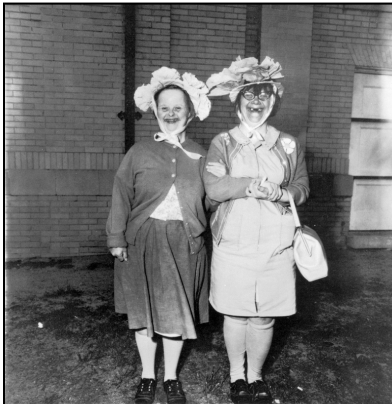
Imagen 1. Diane Arbus (1970-1971) Untitled (I).

Al mismo tiempo sus fotografías constituyen documentos de relevancia en la medida en que, además de permitirnos acceder a mirar a quienes que no eran permitidos fotografiar u observar, y menos aún por una mujer judía, muestran diferentes cuerpos y experimenta con la morfología humana. “Ella se centra en las formas y tamaños inesperados de lo humano, en los cuerpos que están fuera de la norma, y ésta es una manera de poner en relieve la norma, incluso mostrando cuánta inhumanidad alberga la norma” (Butler, 2008:59). Nos interesa particularmente reparar en un conjunto de fotografías que tomó entre 1970 y 1971 a un grupo de mujeres con síndrome de down, jugando en el parque, institucionalizadas. En principio, valoramos la acción misma de fotografiar allí donde las cámaras son prohibidas. Por otro lado, siguiendo a Butler, quien al observar las fotografías rotuladas “sin título” interpreta que muestran la dignidad en la felicidad y el disfrute de las mujeres, lo que se opone a la idea hegemónica de la discapacidad como tragedia personal, como sufrimiento que es construida sobre las mujeres con discapacidad.