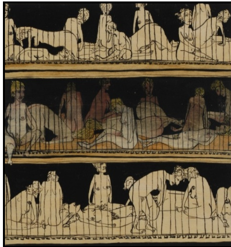
Imagen 7. Sunaura Taylor (2008) Sunnys in chicken cages. Óleo sobre madera. 12' x 12'