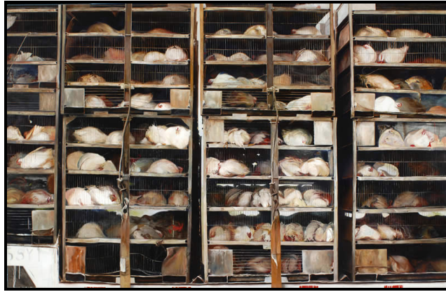
Imagen 6. Sunaura Taylor (2008) Chicken truck. Óleo. 10.5' x 8'