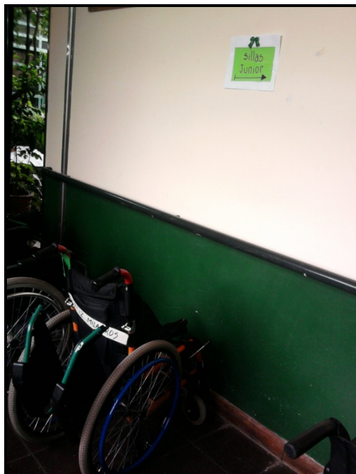
Imagen 5. Fotografía tomada en una escuela especial para personas con discapacidad motriz bonaerense en el marco de nuestro trabajo de campo. Año 2013

encuentran “de espaldas” al pasillo, por lo que podemos pensar que siempre se encuentran dispuestas de éste modo.