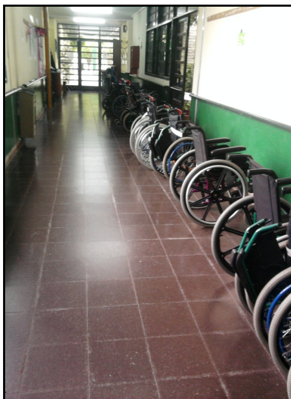
Imagen 4. Fotografía tomada en una escuela especial para personas con discapacidad motriz bonaerense en el marco de nuestro trabajo de campo. Año 2013

que las escuelas en las que desarrollamos esta investigación sumaron la prohibición de tomar fotos de la escuela en general. De modo que no hemos podido contar con imágenes de alumnas en contexto escolar. Consideramos que esta medida cautelar si bien, por un lado, protege la imagen de los/as niños/as, también puede vulnerarlos. No disponer de la posibilidad de documentar fotográfica o filmicamente las condiciones en que alumnos/as con discapacidad transitan su día a día escolar impide la posibilidad de dar cuenta de situaciones posiblemente violentas en términos simbólicos o físicos. Esto, además se intensifica si consideramos a todas aquellas personas a quienes no les es dada la posibilidad de comunicarse y contar o denunciar alguna situación violatoria de algún derecho.