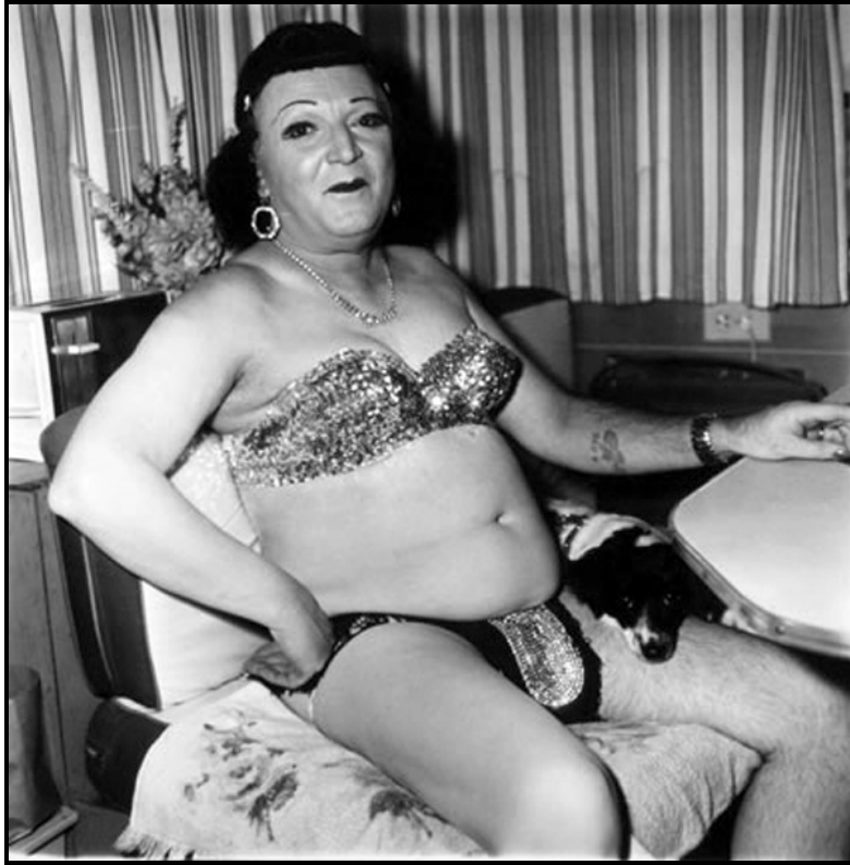
Imagen 2. Diane Arbus (1970) Hermaphrodite and a dog in a carnival tráiler, Md.